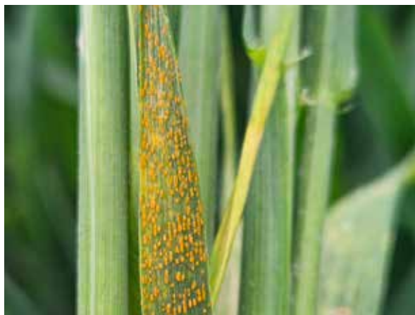
Gulrost i höstvete

Generellt sett har det varit segt med kväveupptaget men det har kommit igång nu och det ser gynnsamt ut, framför allt för vårgrödorna.