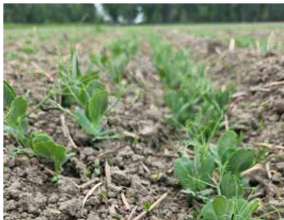
Bra läge för ogräsbekämpning i ärter

Många lantbrukare har ett mer återhållsamt förhållningssätt för insektsbekämpning på våren, för att skydda nyttoinsekterna.