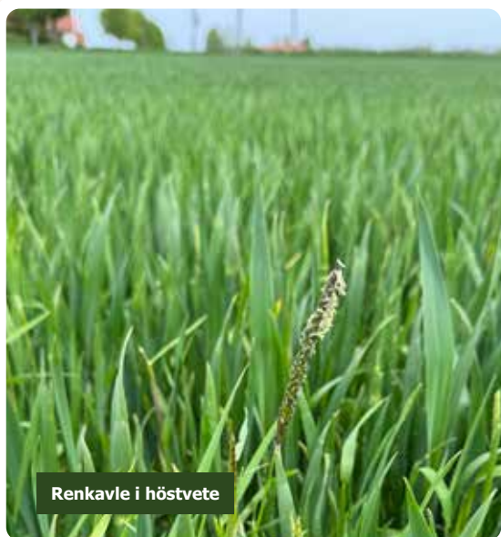
Renkavle i höstvete

Arealen av blommande åker har nästan fördubblats i år. En del lantbrukare ställer ut halmbalar, humleholkar och annat som gynnar insekterna. För övrigt är det mest lagstiftningen som styr.