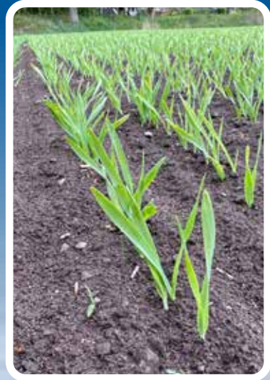
Hönshirs i vårkorn