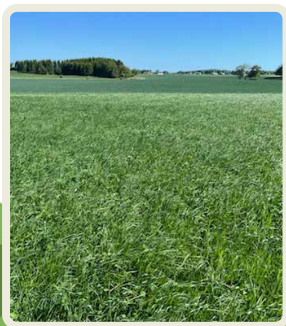
Vall i mellersta Skåne

Många satsar på blommande fältkanter, en del sätter ut halmbalar som lockar humlor. En kund har byggt kombinerad våtmark och bevattningsdamm.