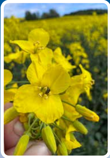
Höstraps i full blom