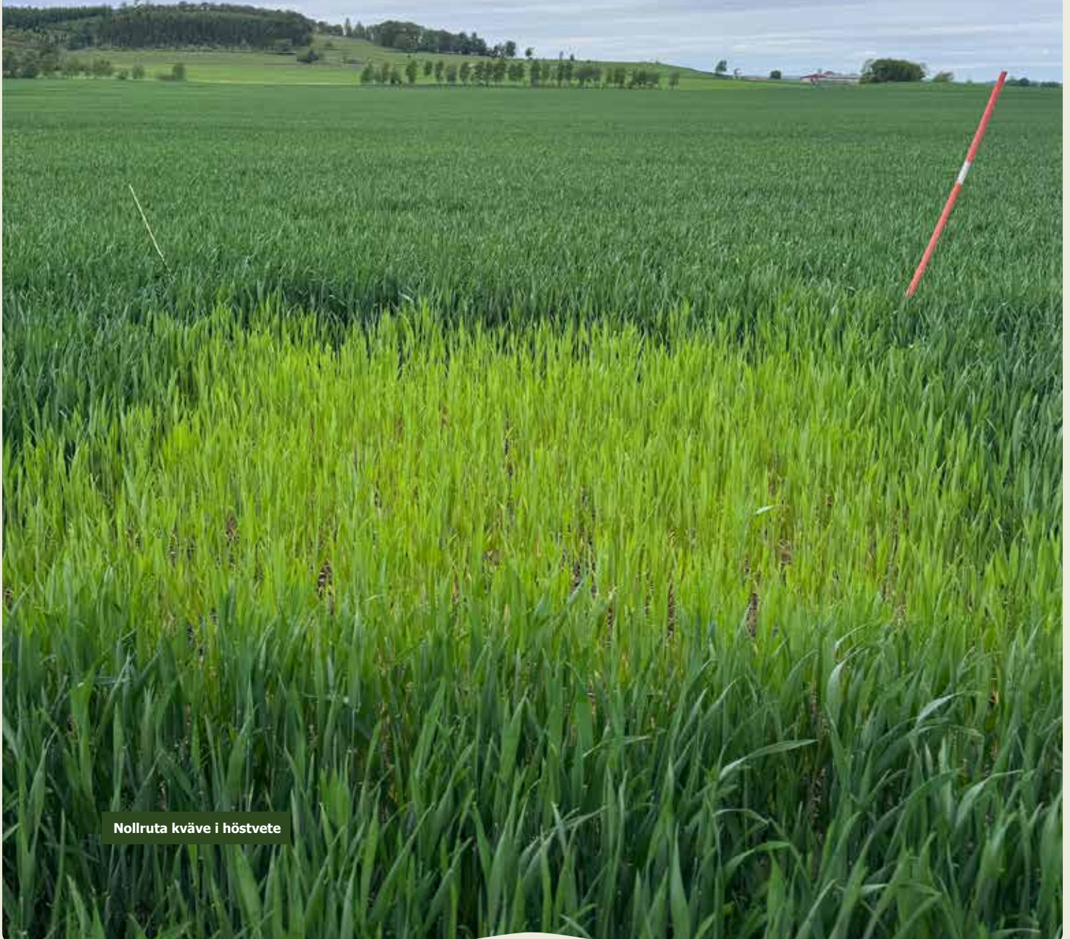
Nollruta kväve i höstvetete