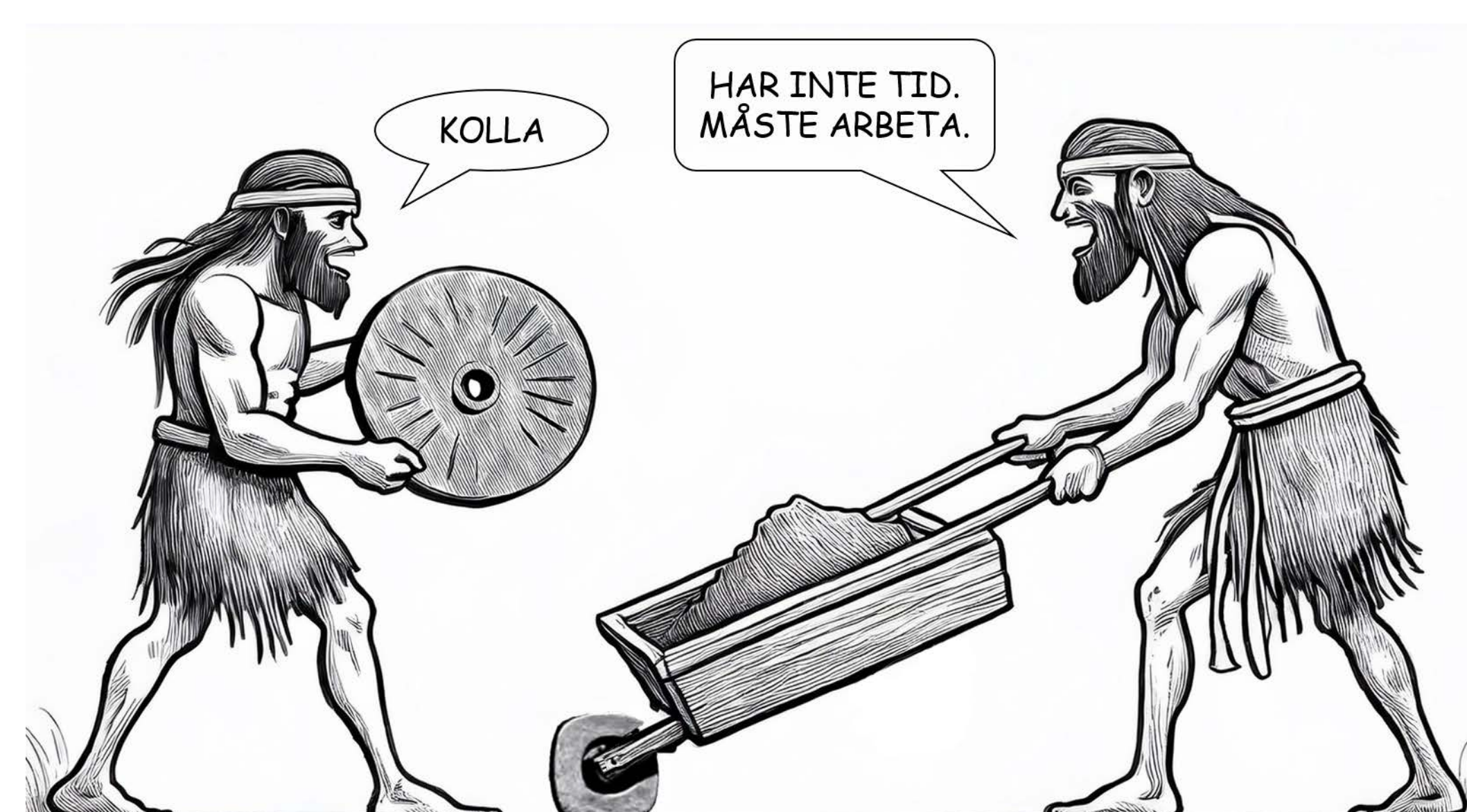
AI-genererad bild med bearbetning av Therese Östrand, SLU.

Genom sju moduler med kunskap och olika reflektionsövningar får du insikter om hur du kan förbättra din verksamhet genom att minska slöseri och jobba smartare och effektivare istället för snabbare och hårdare. Du får också titta närmare på din gårds ekonomi och fundera över dina mål och din arbetssituation. Via Företagslyft Lantbruk - nöt & lamm tar du små steg mot en långsiktigt hållbar verksamhet. Metoderna bygger på beprövade arbetssätt, såsom Lean, och hjälper dig att göra rätt saker på rätt sätt.