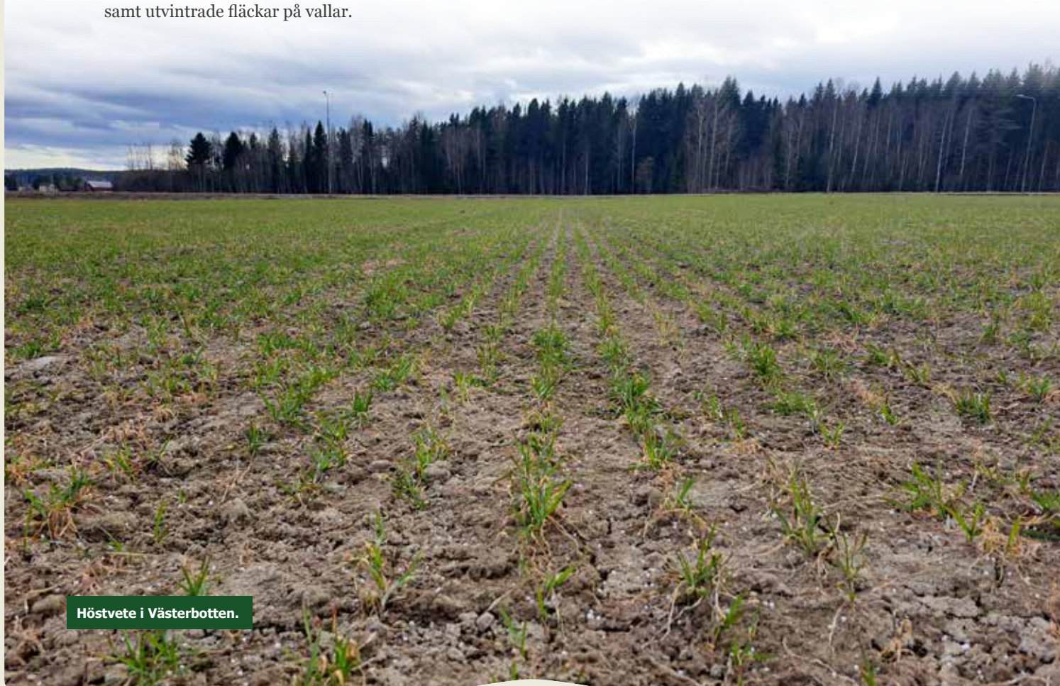
Höstvetete i Västerbotten.

De höga gödselpriserna påverkar lantbrukarna i området. De som inte köpte mineralgödsel i höstas väntar i en del fall fortfarande på lägre priser och har alltså inte beställt gödsel till vårbruket. En del lantbrukare kommer att köra lägre gödselgivor på grund av det höga priset.