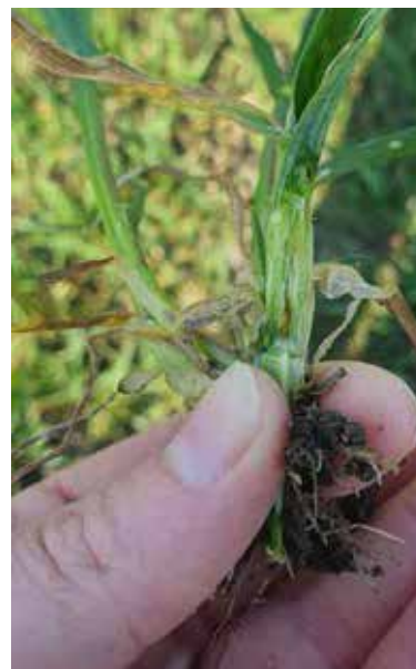
Angrepp av kornfluga.