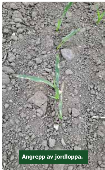
Angrepp av jordloppa.

Vi får många frågor kring jordloppor i vårsäd då det var ett stort problem ifjol. Problemet var att