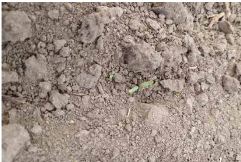
Sockerbeter i hjärtbladsstadium.

Lantbrukarna sitter stilla i båten och är lite försiktiga.