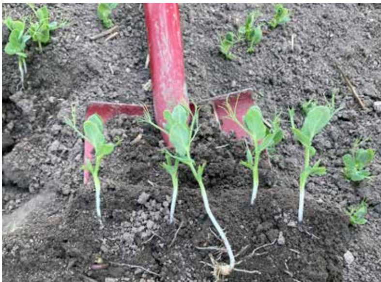
Ärtor med mycket fint rotsystem sådd i jord med bra struktur.

Lantbrukarna är försiktiga med nya investeringar och man känner generell osäkerhet för hur omvärlden kommer påverka prisutvecklingen.