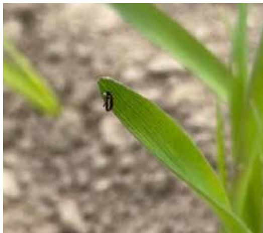
Det är oroväckande mycket insekter i området, bland annat ser man mycket kornjordloppa