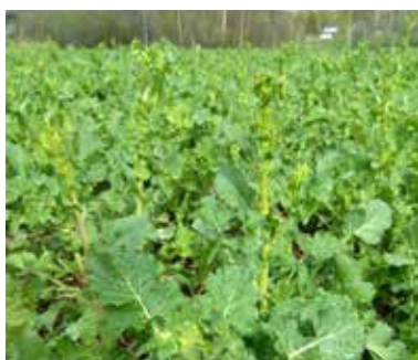
Höstrybsen sträcker på sig i Hälsingland.