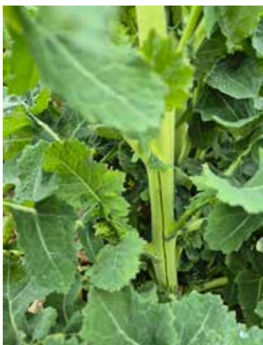
Sprucken raps i Örebro.

Vårbruket är i princip klart i området och det vårsådda börjar komma upp så smått. Det kan eventuellt finnas lite vörraps och havre kvar att så. Totalt sett gick vårbruket väldigt bra, med bra förutsättningar. Det var förvisso