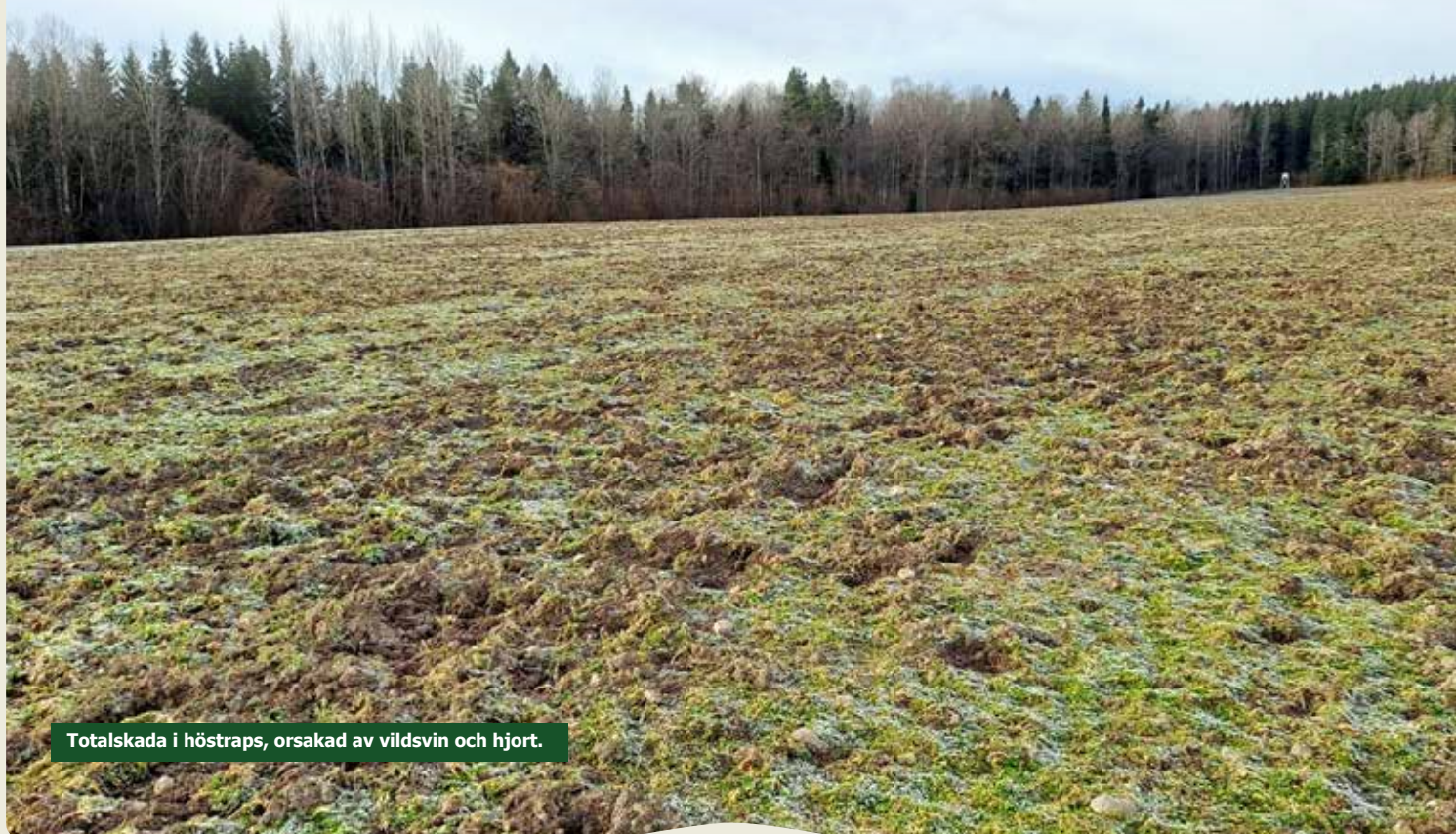
Totalskada i höstraps, orsakad av vildsvin och hjort.

De som har skog är ganska nöjda och satsar. Det finns oro för en ökad prisbild samt en generell oro som inte är specifikt knuten till lantbruket. Man funderar på handelsgödselet priset och undrar vilken väg det kommer att gå.