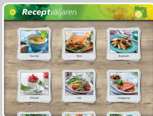
I Receptväljaren finns 14 stycken olika kategorier att välja mellan