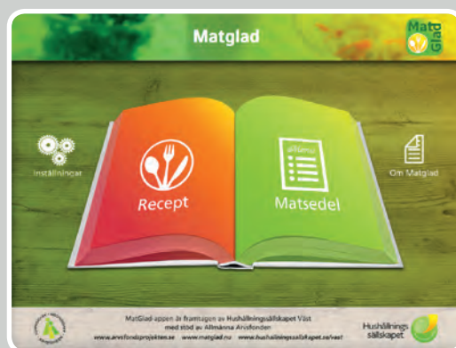
MatGlad startsida Välj recept: Klicka på den röda sidan