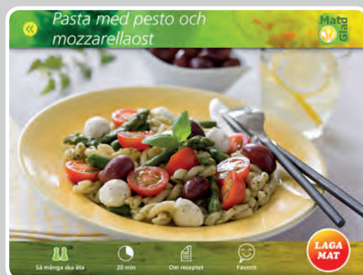
Varje maträtt har en inspirerande bild.