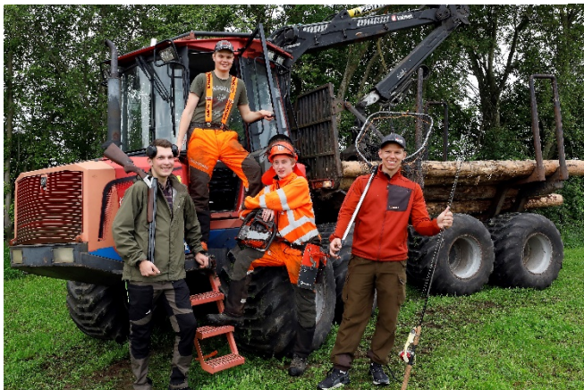
Elever vid Naturbruksgymnasiet i Önnestad.

Hushållningssällskapet består av ett förbund och 15 fristående Hushållningssällskap som arbetar med lantbrukets och landsbygdens utveckling efter regionala förutsättningar. Drygt 900 medarbetare – främst rådgivare, lärare och projektledare – sysslar med rådgivning, utbildning, forskning och fältförsök inom lantbruk, skog, offentlig verksamhet och besöksnäring. Det gemensamma varumärkeslöftet är Kunskap för landets framtid.