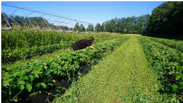
Skörd av demoodling jordgubbar i Öjebyn med blomsterremсор i bakgrunden.

Försöket finansieras av Hushållningssällskapet Norrbotten-Västerbotten. Sorterna har valts ut i samarbete med NBG. (Norrbottens Bär och Grönt)