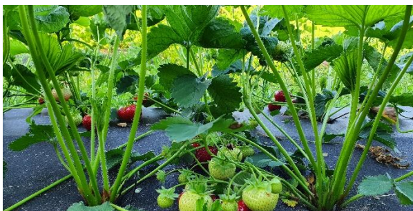
Vackra sorten Sonsation.