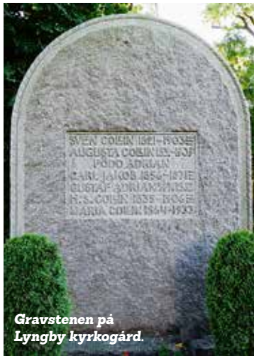
Gravstenen på Lyngby kyrkogård.