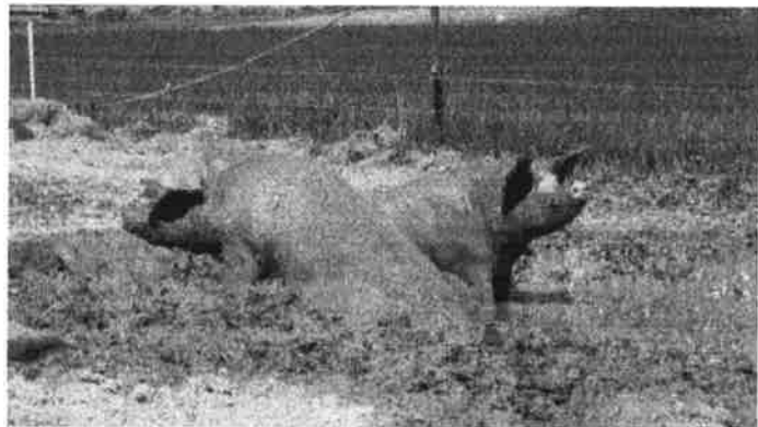
Passar konventionella grisar i ekologisk produktion?

Utvecklingen av produktionssystem och avelsstrategier i enlighet med principerna för ekologisk produktion kräver ökad kunskap om hur grisar fungerar i ekologiska produktionssystem.