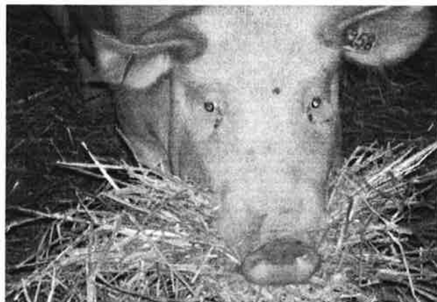
Mer bobyggnadsbeteende när suggor grisade ute i hydda jämfört med när de grisade inne i box.

Resultaten visar att suggorna utförde mer bobyggnadsbeteende och påbörjade bobyggnadsaktiviteten tidigare när de grisade ute i hydda jämfört med när de grisade inne i box. Grisningen gick snabbare och förekomsten av dödfödda smågrisar var lägre när suggorna grisade ute i hydda jämfört med inne i box. När flera suggor och deras smågrisar hölls i grupp under digivningsperioden var suggornas och smågrisarnas avvänjningsprocess redan långt gånge när skötaren separerade suggorna från smågrisarna ungefär 7 veckor efter grisning. Vårt resultat visar att avvänjningsprocessen påskyndas av lägre hullstatus och större antal diande smågrisar.