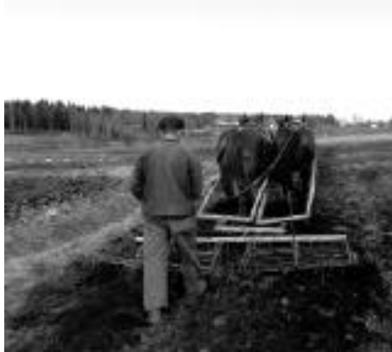
Harvning, bilden från Brunskog.