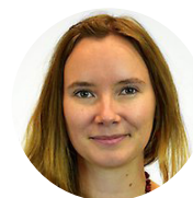
My Sellberg doktorand, Stockholm Resilience Centre

Hur kan sårbarheten inom livsmedelsförsörjningen minskas och hur kan mat bidra till hållbar utveckling? Vad innebär det behovet av att skapa en säker och hållbar livsmedelsförsörjning? Forskningen om resiliens belyser exempelvis hur ett samhällssystem kan anpassa sig, fortsätta utvecklas och förnyas i en föränderlig omvärld. Konkret exempel från Eskilstuna som har gjort en handlingsplan tillsammans med kommunens näringsliv och organisationer.