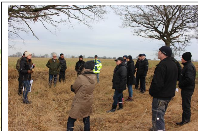
Bild från vattenvandringen längs Hagbyån 4 mars

Träffen är kostnadsfri. Vi bjuder på fika. Projektet ingår i Greppa Näringen, ett landsomfattande miljöprojekt som syftar till att minska övergödningen till kusten. Varmt välkommen till en dag för de viktiga vattendragen.