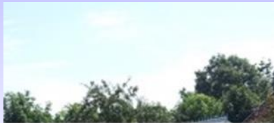
Fibernet för bredband på landsbygden

Projekt → Jordbrukssektorn → Annat landsbygd