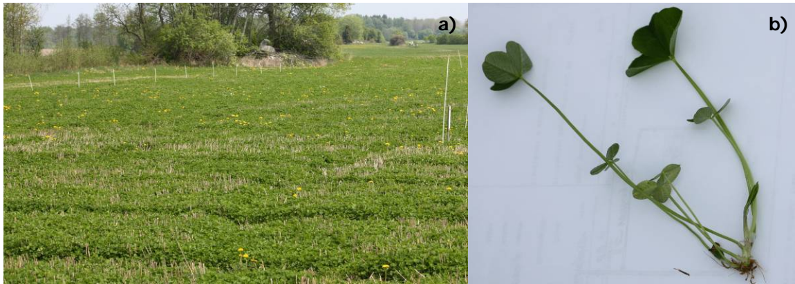
Figur 1. a) Vitklöverfält och b) plantans storlek dagen efter bladgödsling, fröåret.