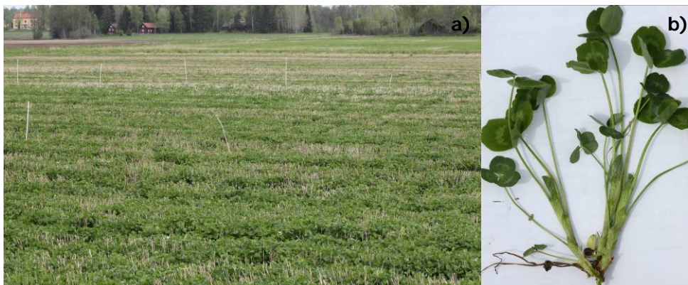
Figur 2. a) Rödklöverfält och b) plantans storlek vid bladgödsling, fröåret.