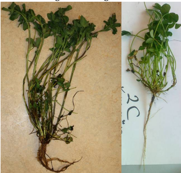
Figur 3. a) Rödklöver- och b) vitklöverplanta i knoppstadium.

Fröskördeåren analyserades borhalten i jord, rötter och de yngsta delarna av grönmassan rutvis i knoppstadium (figur 3 a och b). I samband med provtagningen av rötter och grönmassa, graderades rotröta i sex rötter per ruta enligt Rufelt (1986).