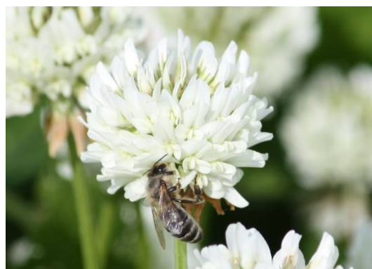
Figur 5. Vitklöverblommor som pollineras.

I tabell 6 och 7 presenteras resultaten från blom- och nektarmätningarna i respektive försök av vitklöver. Bortillförsel ökade nektarvolymen vid en sammanslagning av samtliga försök och ökningen var störst då bor tillfördes till bladmassan fröåret (Stoltz & Wallenhammar, a). Övriga parametrar påverkades inte signifikant av bortillförsel (tabell 6 och 7). Pollinering av vitklöverblommor visas i figur 5.