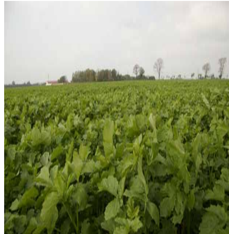
Bestånd 10 okt