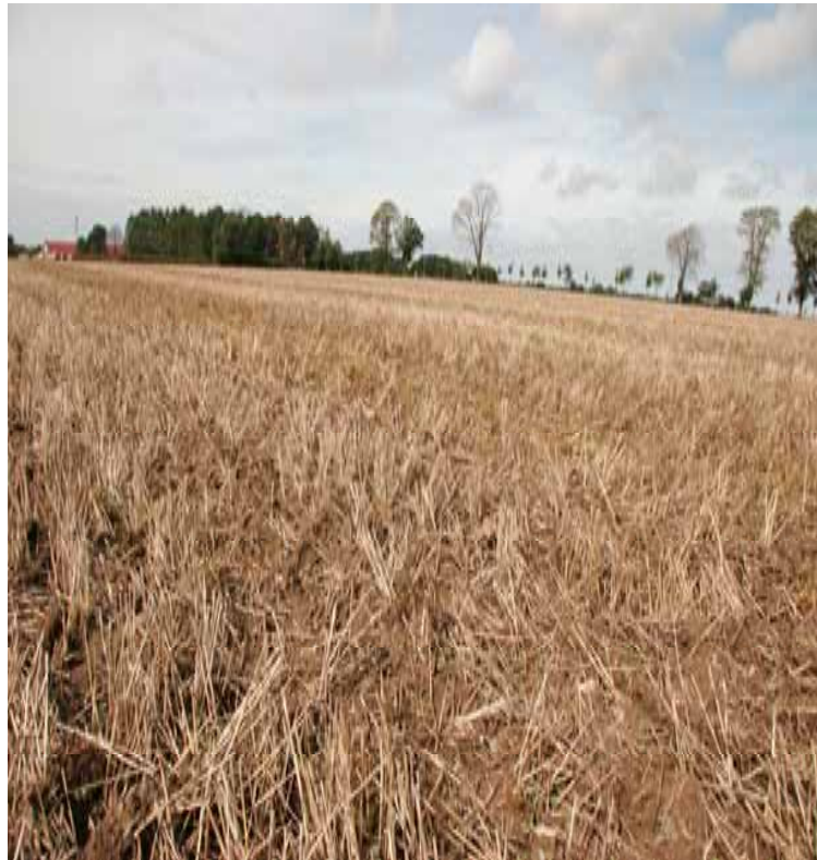
Sådd 20 aug