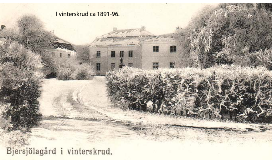
I vinterskrud ca 1891-96.