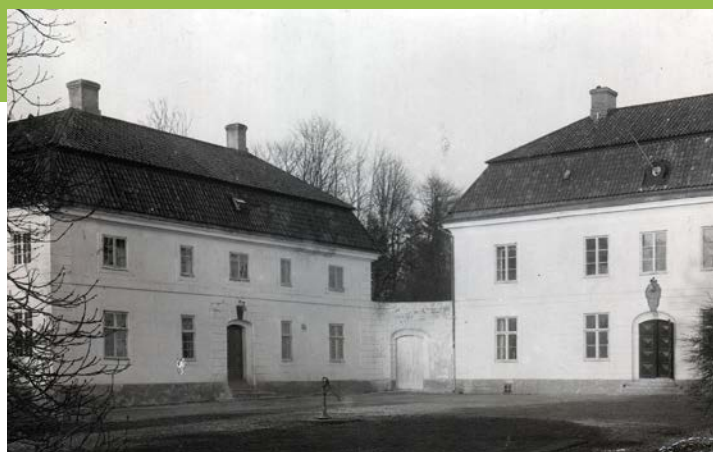
Cirka 1920 med rickepumpen på gårdsplan.

På en rundvandring i dagens trädgård ser man få spår efter den ursprungliga planen. Monokultur i form av stora gräsytor dominerar. Mullvadar och sorkar har byggt kulvertar i jorden och underminerat delar av parken. Idag stavas idealet minimalt med underhåll. Entrén är sparsmakad och stram. Två halmade pyramidalmar flankeras av praktfulla magnolior längs gången. Mitt för slottsportarna finns en stor rabattrundel. De skötselkrävande rosorna har tagits bort och ersatts av tuktade häckoxbär som mjukas upp av blåblommande vårljung. Innanför muren löper långa perennrabatter med omväxlande vintergröna och flocknäva som marktäckare. Höjd skapar valnötsträd, trollhassel, häggmispel, syren och forsythia. I öster breder en stor gräsplan ut sig med bågformade stenbänkar där förr den engelska parkens gångar löpte.