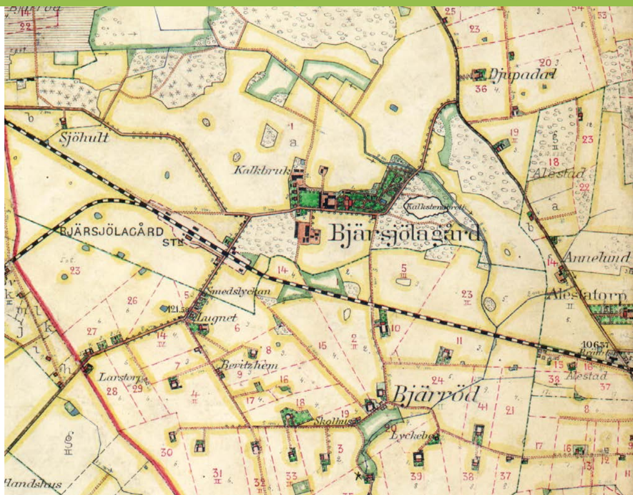
Häradsekonomska kartan från 1915.